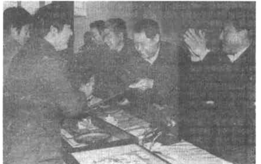
市政府就落实省电话会议提出要求

会议号召,九十年代的第一个春天刚刚来临,全市上下都要以崭新的精神风貌,团结求实,艰苦创业,为实现我市农村工作的“开门红”,为夺取开发建设黄河三角洲的新胜利而努力奋斗!▽