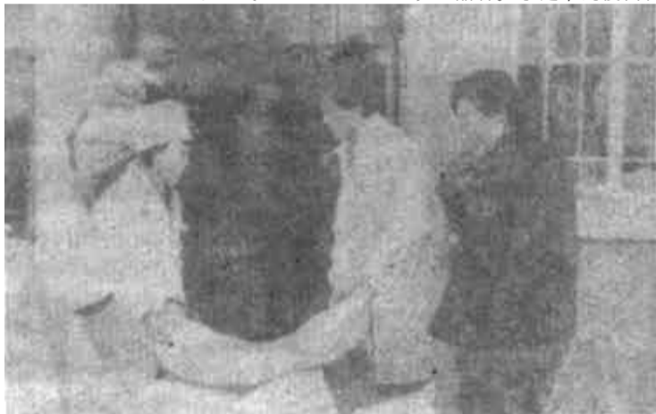
△ 东营区粮食分局基西粮店,自1988年开始为老弱病残家庭和老干部送粮,到去年底,累计送粮2.5万公斤。图为粮店职工为胜利石油管理局干休所的老干部送粮的情景。

1988年以来,该公司先后被评为省供销社精神文明单位、市优质服务先进单位、消费者信得过和重合同守信誉单位,党支部被评为先进党支部。(常景华 吴秀荣)